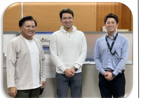
野球部OB(中央)と野球部の顧問

本校5期生で野球部OBの方が1月20日に来校し、後輩のために寄附金を贈呈してくださいました。いただいた寄附は、バットグリップの修理や試合球の購入、バットグリップの補正などに活用します。卒業生からのご支援は、学校にとって大変ありがたく、誇りとなっています。