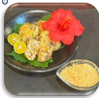
オキふわ盛り ～シーク ワサーごま味噌～

グランプリという素晴らしい賞を頂けてとても嬉しいです！本番は、枝豆を剥くときに豆が飛び出しちゃったりするなどのアクシデントがあったものの、審査員の方のお話を楽しみながら料理を仕上げるのが出来たので良かったです！これからも料理で多くの人を笑顔にしていきたいです！