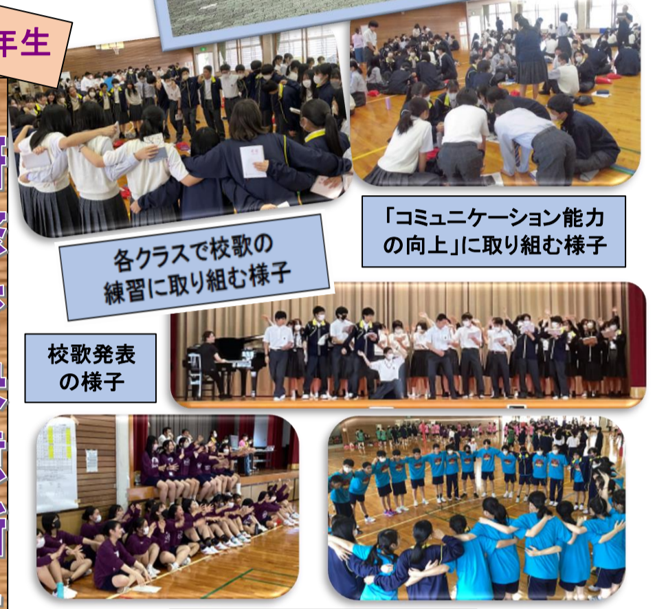
各クラスで校歌の練習に取り組む様子