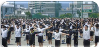
(右) 全校生徒でラジオ体操

「新体力テスト」が爽やかな青空のもと、4月24日、本校グラウンド・体育館・武道場等にて実施されました。グラウンドにて準備体操後、「反復横跳び」や「50M走」「ボール投げ」「握力測定」「立ち幅跳び」「長座体前屈」等、各種目に分かれて行われました。