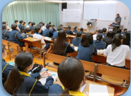
2年生「難関大学講座 特別講話」にて